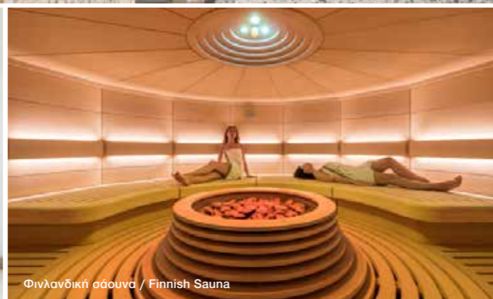
Φινλανδική σάουνα / Finnish Sauna