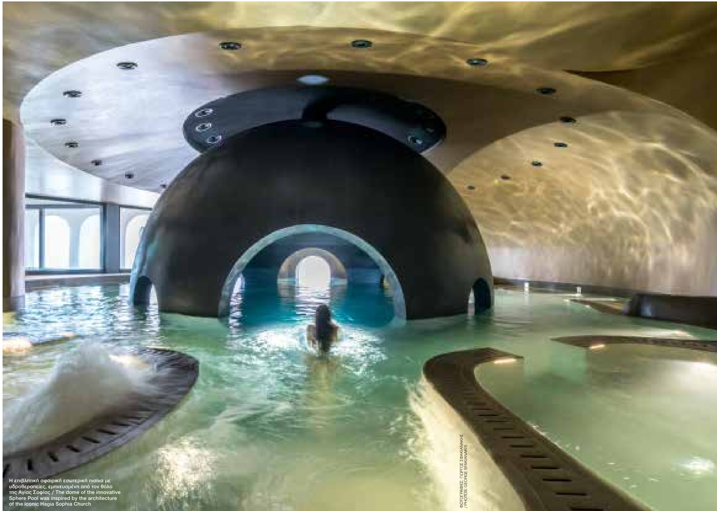
Η επιβλητική σφαιρική εσωτερική πισίνα με υδροθεραπείες, εμπνευσμένη από τον θόλο της Αγίας Σοφίας / The dome of the innovative Sphere Pool was inspired by the architecture of the iconic Hagia Sophia Church