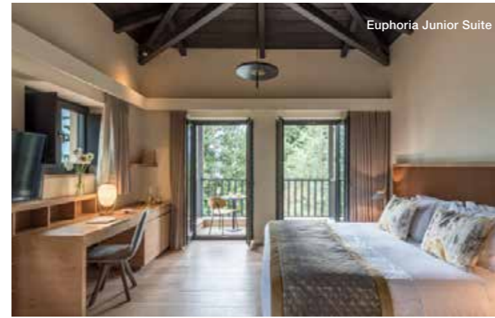
Euphoria Junior Suite