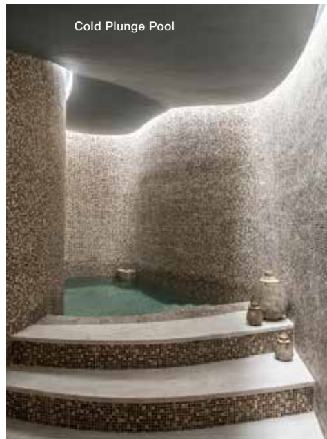
Cold Plunge Pool

Info: Mystras, Sparta, tel. +30 27313-06111, reservations@euphoriaretreat.com , www.euphoriaretreat.com