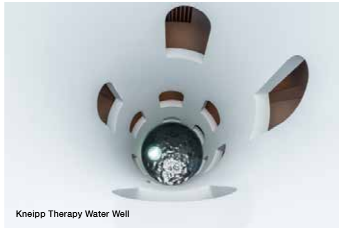
Kneipp Therapy Water Well

«Ανακάλυψα ότι η απάντηση στα ερωτήματά μου βρισκόταν στην ελληνική μου κληρονομιά, στον τόπο μου. Έναν τόπο που έδωσε στους αρχαίους Έλληνες φιλοσόφους