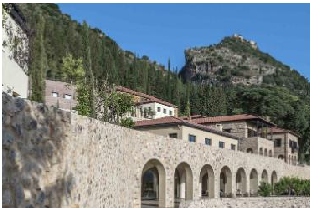
Un retiro en la bella Mistra

bicicleta, practiquen trekking y disfruten de clases al aire libre. La hermosa playa de Gytheion, por cierto, está a solo 40 minutos en coche, y Atenas, a dos horas y media. ¡Puede ser la parada perfecta para sanar y desconectar en tu próximo roadtrip por Grecia!