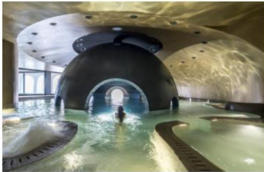
Un spa como nunca habías visto

"Desde las salas de tratamiento y gimnasio en la planta baja, pasando por las instalaciones acuáticas (el tepidarium , el hammam bizantino, la piscina Watsu, la sauna de vapor, la sauna finlandesa, etc.) y subiendo hasta las salas de yoga y meditación, así como a los espacios al aire libre con vistas panorámicas, los huéspedes son guiado en un viaje de cambio interior. La innovadora piscina esférica (cuya forma surgió al imaginar cómo habitar el vacío de un volumen platónico flotando en el centro de una esfera) proporciona una experiencia de relajación y renacimiento similar a la de un útero", añaden sus responsables.