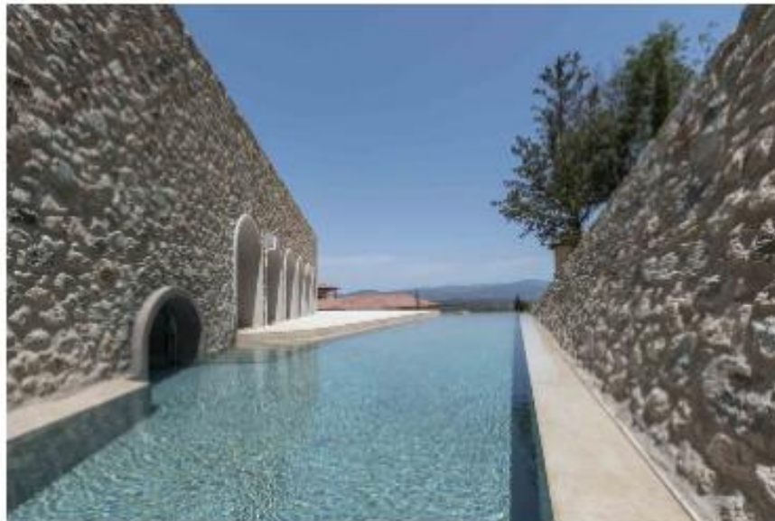
Relajación con vistas